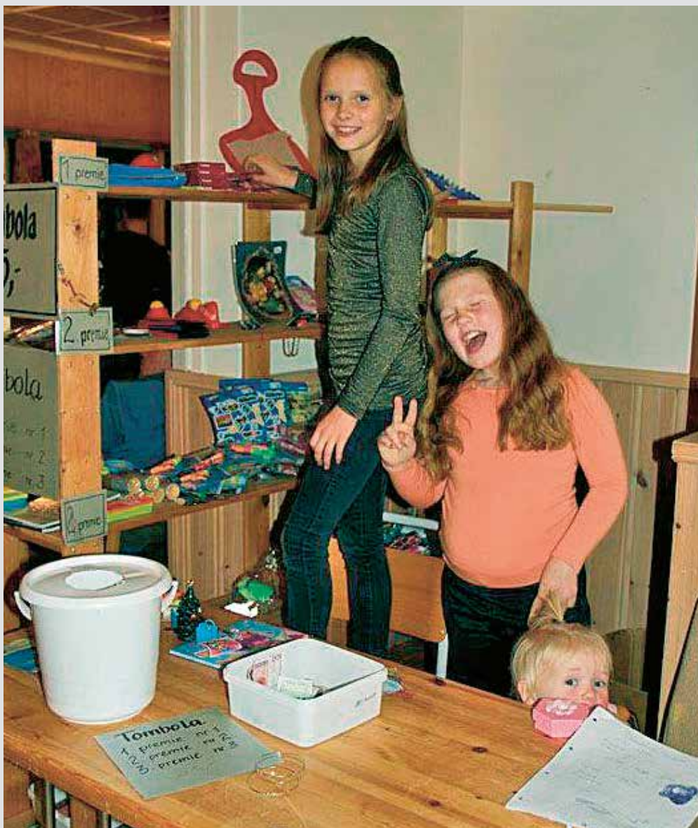
Flinke jenter har kontroll på Tombolaen.

– Av forskjellige årsaker greier vi ikke det målet, men jeg vil tro at over 90 prosent av husstandene i kommunen får besøk. Det selges også en del lodd i Rissa og Leksvik og flere andre steder på Fosen i forkant av julesalgs-