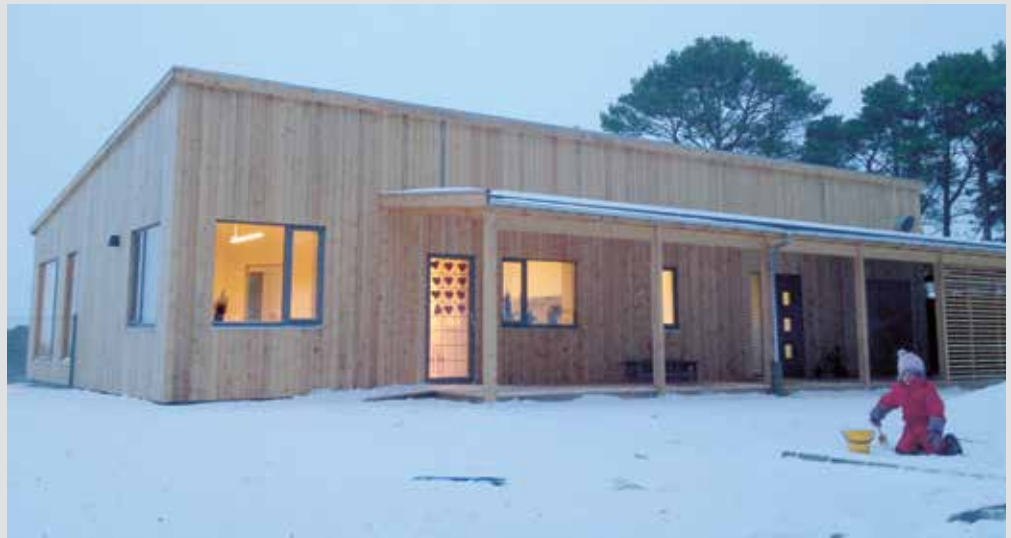
Lilleval på området til Val videregående skole i Nærøy flyttet i høst inn i nye lokaler.