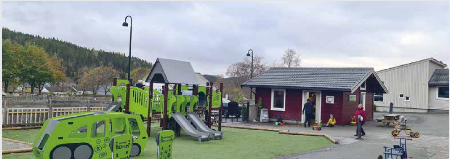
Heggli Barnhage i Åfjord har nå samlet alle avdelinger under samme tak i nye lokaler.