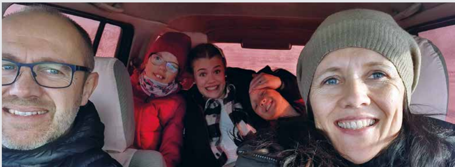
Fem av familien Jonasmo.