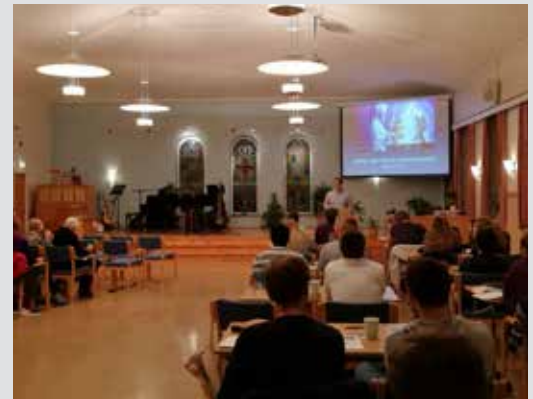
Det var godt fram møte da distriksbibelskolen fra Fjellheim besøkte Bodø.

Vi må be Gud om å reise opp frimodige vitner med nådegaver til å forkynne og evangelisere, også i vår tid. Men vi må også be Gud vise oss de anledningene han vil at du og jeg skal bruke til å si noe om Jesus til andre.