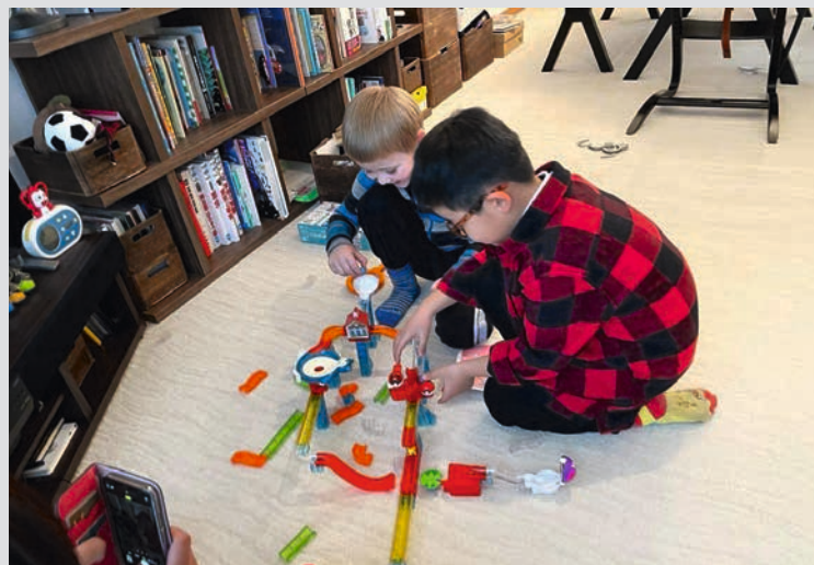
BEGGE FOTO: TONE TRÅSDAHL