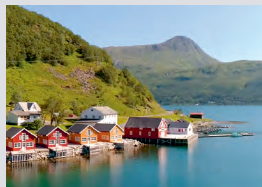
Ei uke for fire personer er førstepræmien i årets regionlotteri.

For i Jesu navn ønsker vi virkelig å «gi til Guds rike».