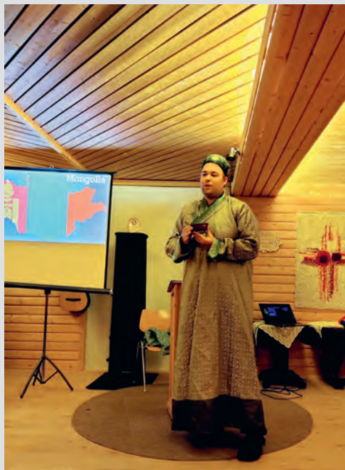
Misjonstimen ble fra Mongolia for deltakerne på familieleir denne vinteren.