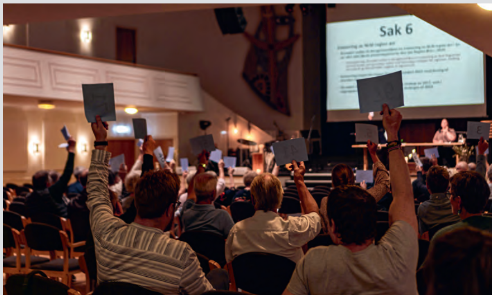
Regionårsmøtet for Misjonssambandet øst i 2021 ble avviklet i Misjonssalen Oslo 4. september. På årsmøtet var det 75 stemmeberettigede inkl. medlemmer av regionstyret og barne- og ungdomsrådet (BUR) med stemmerett.