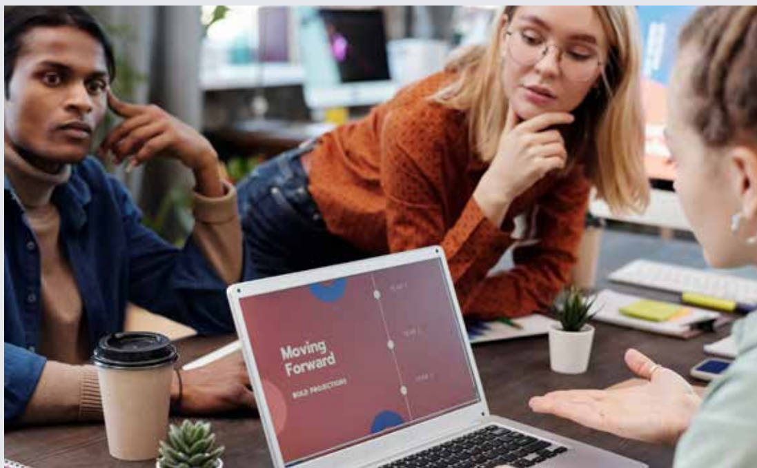
STYREARBEID: Å sitte i et styre innebærer ulike aspekter. Mange ting kan havne på styrebordet.