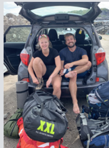
NORGESFERIE: Til sommeren er ferieplanen Midt-Norge. – Vi liker å ha god tid, telte i bilen og stoppe der vi synes det er fint.