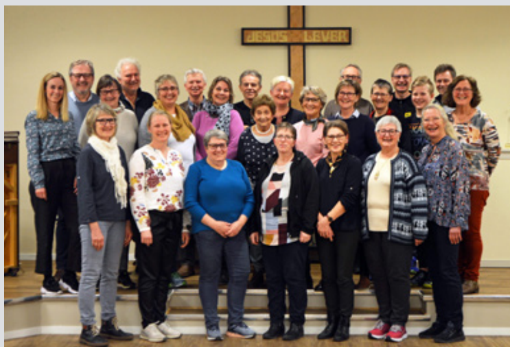
Generasjonskoret, Gla'sang, lever opp til navnet sitt. God stemning på korøvelse.