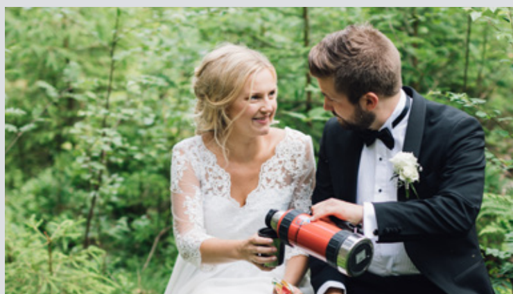
FALT PLADASK: 16. juni 2018 giftet de seg og tok kaffen i skauen. – Jeg falt for han fordi han var så snill og kjekk, det må du få med at jeg svarte. Han hadde ikke skjegg da vi ble kjærester, det har han fått mer og mer av jo lenger vi har vært sammen, sier hun, kjempefornøyd med påvirkningen.