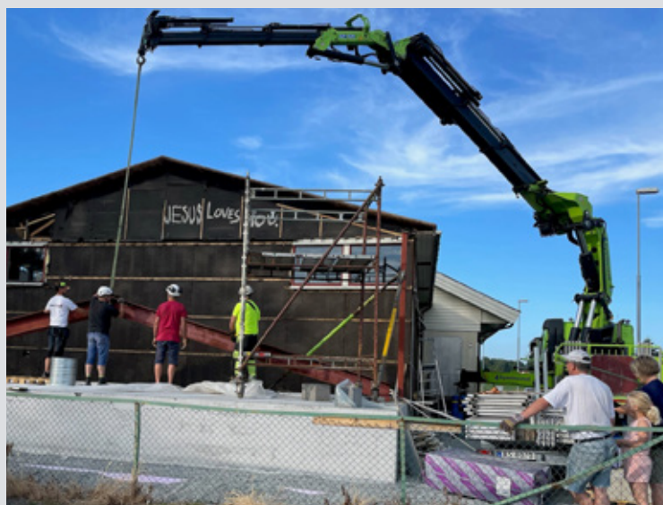
Både små og store har vært i sving på dugnadsarbeidet for å få det nye bygget i stand.