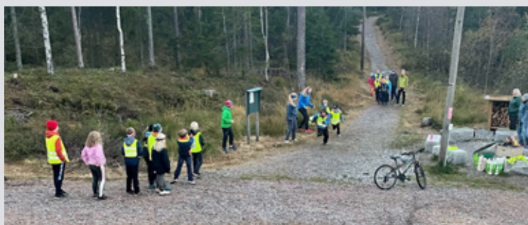
Det er full fart når barneklubben leker ute.