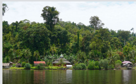
En liten landsby langs elvebredden på en av øyene hvor Misjonssambandet driver arbeid.