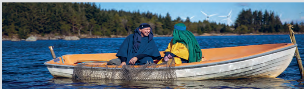
Peter og Johannes på Tiberiassjøen lurer på om de skal kaste garnet på den andre siden, slik Jesus sa.

Ut ifra årets store pågang er dette en tradisjon som har kommet for å bli.